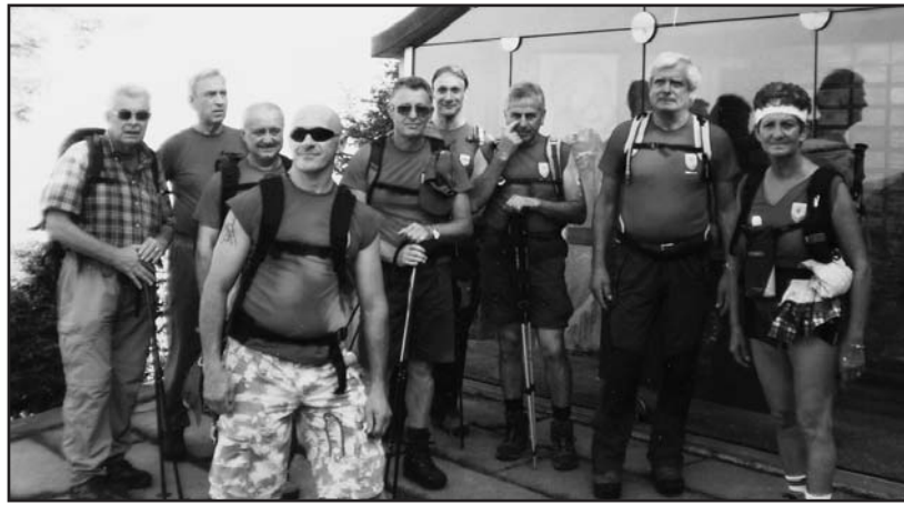
Alcuni componenti dell'Associazione.

Il gruppo è sempre più coeso e non v'è membro che non si prodighi nell'aiuto reciproco,