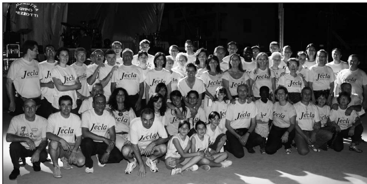
Al termine della festa foto di gruppo dei volontari.