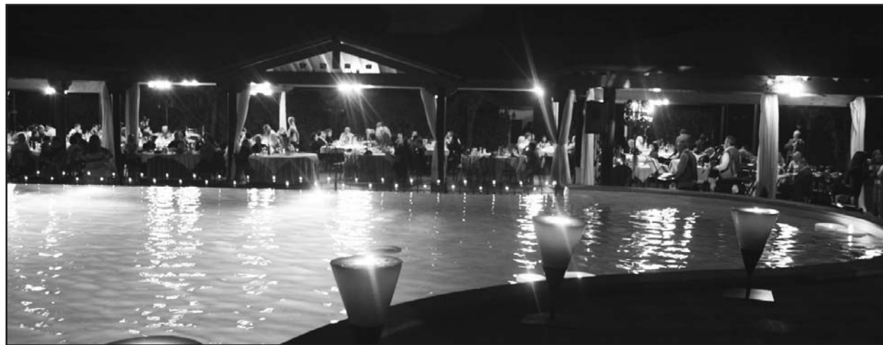
Suggestivo buffet a bordo piscina.