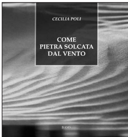
La copertina del libro-diario di Cecilia Poli.